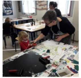
De kinderen konden kennismaken met de werking van de academie.